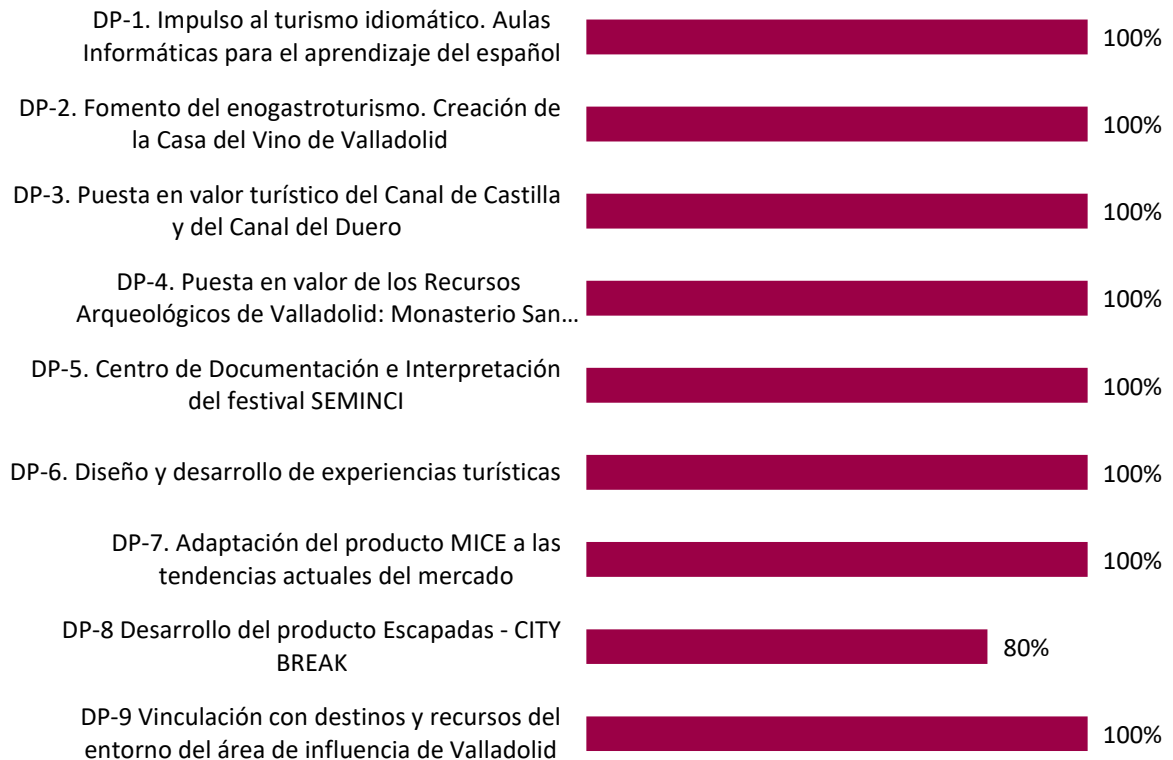
Gráfico 3. Grado de ejecución de las actuaciones que conforman la línea de Desarrollo de Productos