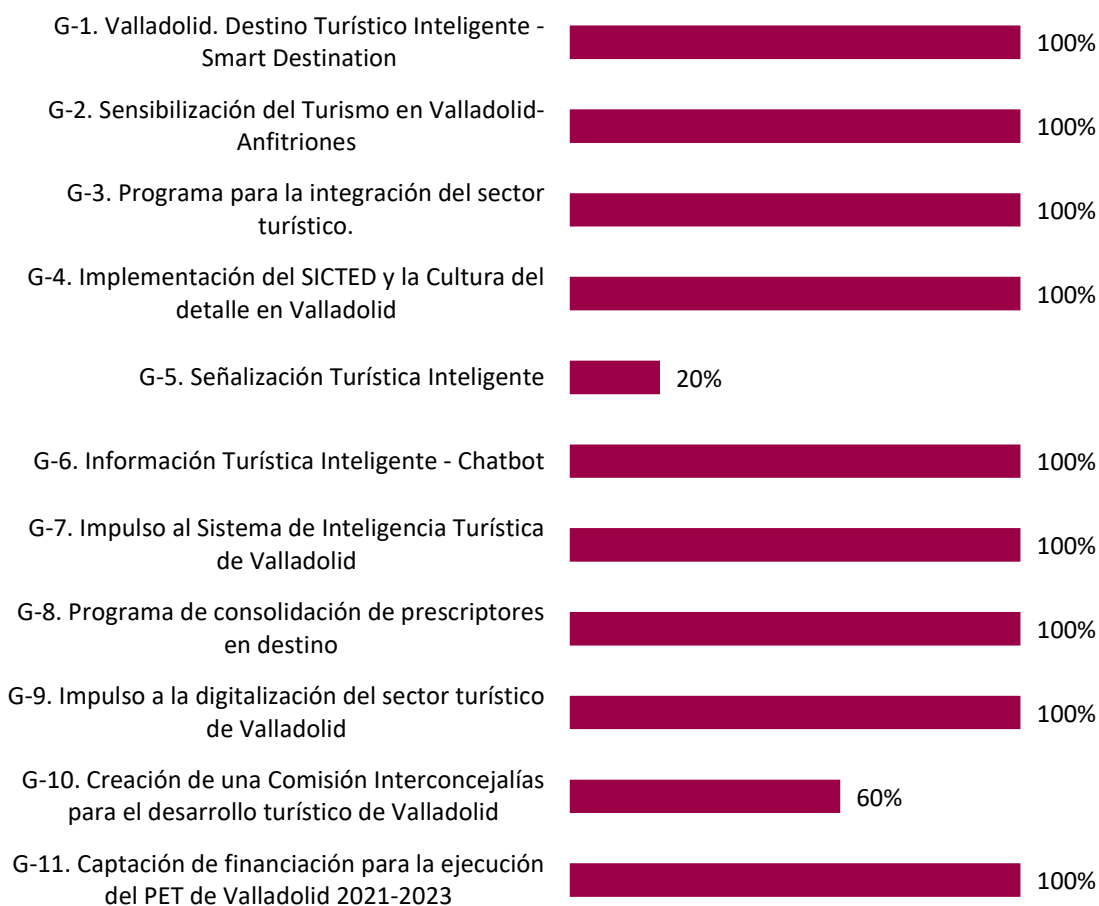
Gráfico 1. Grado de ejecución de las actuaciones que conforman la línea de Gobernanza