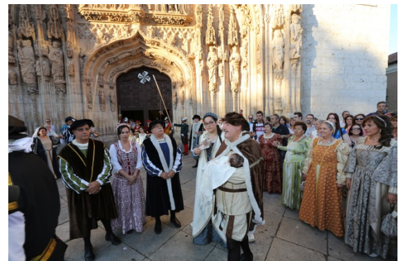
Comitiva del bautizo de Felipe II, año 2015