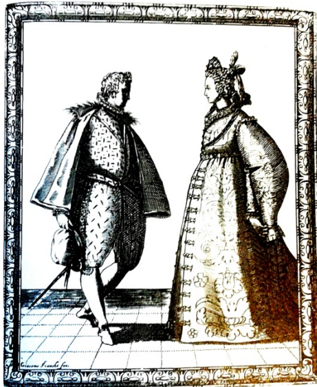
Tratado Nobiltà di Dame de Fabritio Caroso (1600)