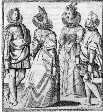
Tratado Le Gratied' Amore , de Cesare Negri (Milán 1602)