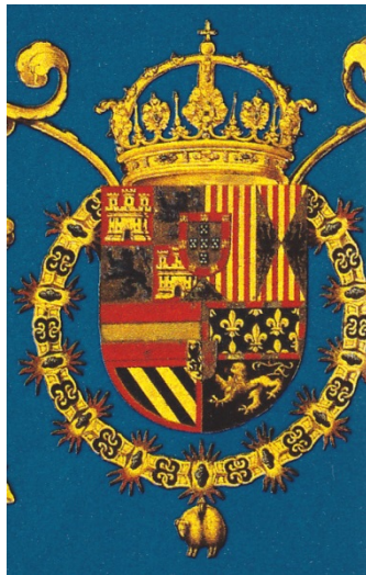
Escudo de Felipe III Monasterio de San Lorenzo del Escorial